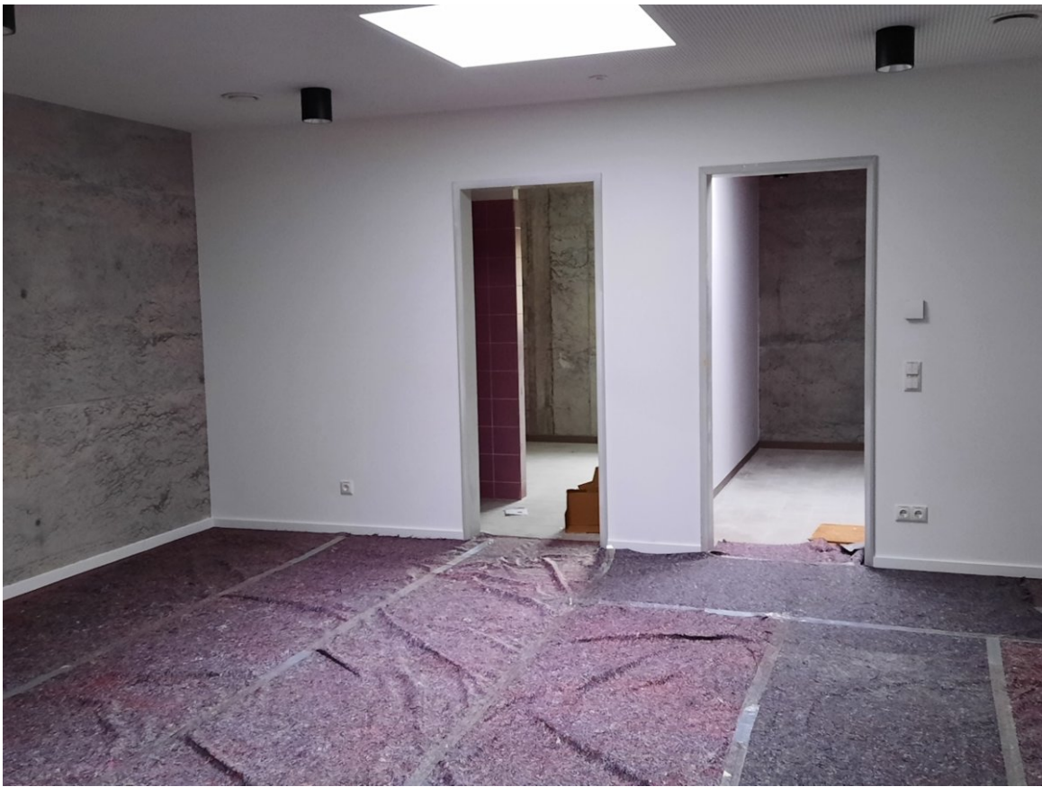
Wirtschaftsgebäude