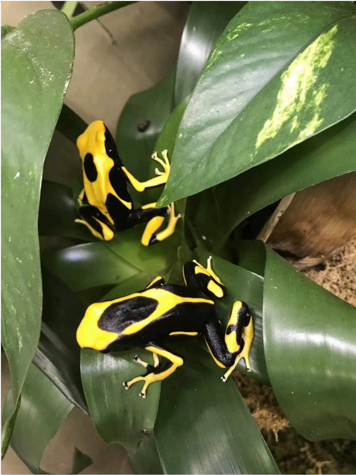
Pfeilgiftfrosch - Thomas Lipp