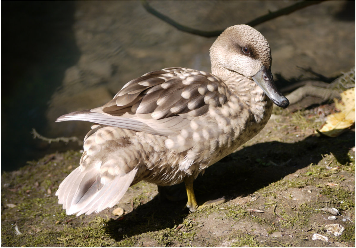
Marmelente - Jutta Schweizer