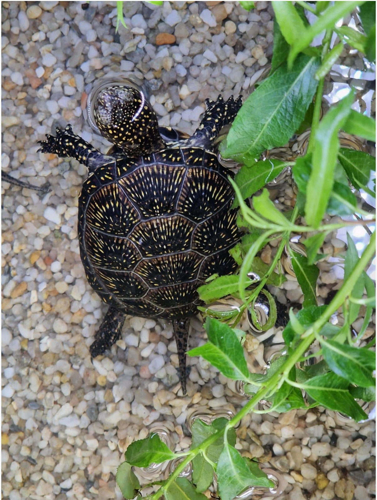
Sumpfschildkröte - Zoo Augsburg