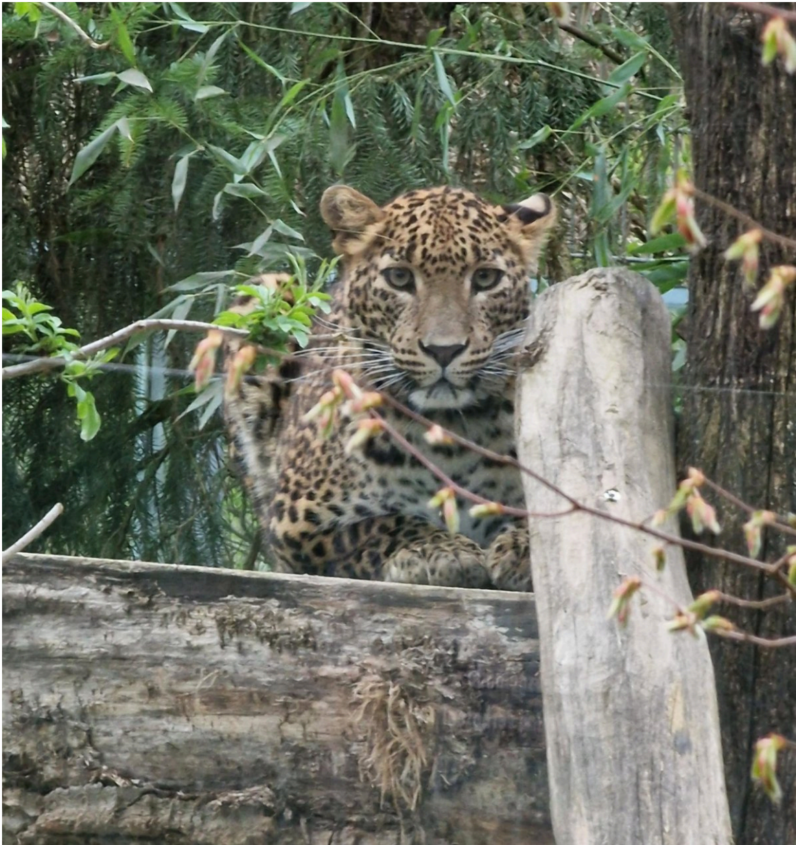
Leopard - Peter Bretschneider

Daher ist das Tigerhaus derzeit auch noch geschlossen. In der nächsten Zeit werden wir es aber wieder öffnen.