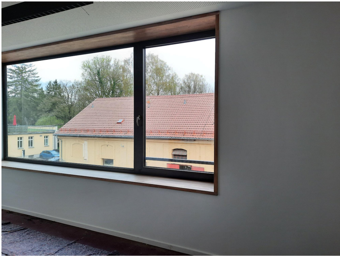
Wirtschaftsgebäude – Barbara Jantschke