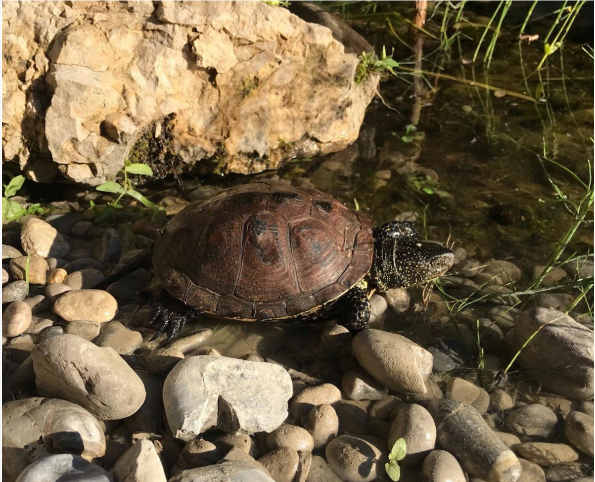
Sumpfschildkröte - Thomas Lipp

Und auch die Feuersalamander durften inzwischen ihren Überwinterungskühlschrank verlassen und sind wieder in ein Terrarium gezogen.