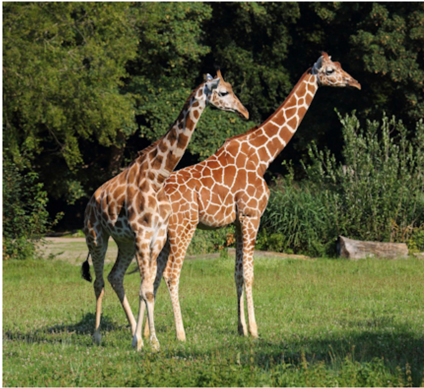
Zarafa und Kimara