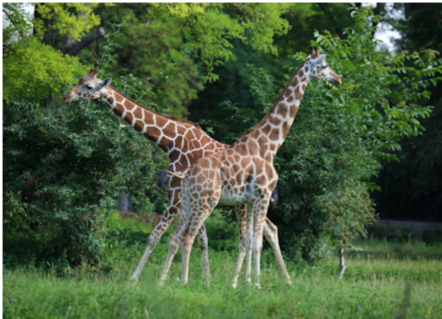
Zarafa und Kimara