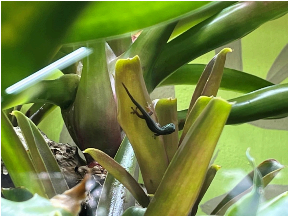
Zwerggecko Jungtier - Thomas Lipp

Weiters haben sechs gelbgebänderte Baumsteiger die Metamorphose abgeschlossen.