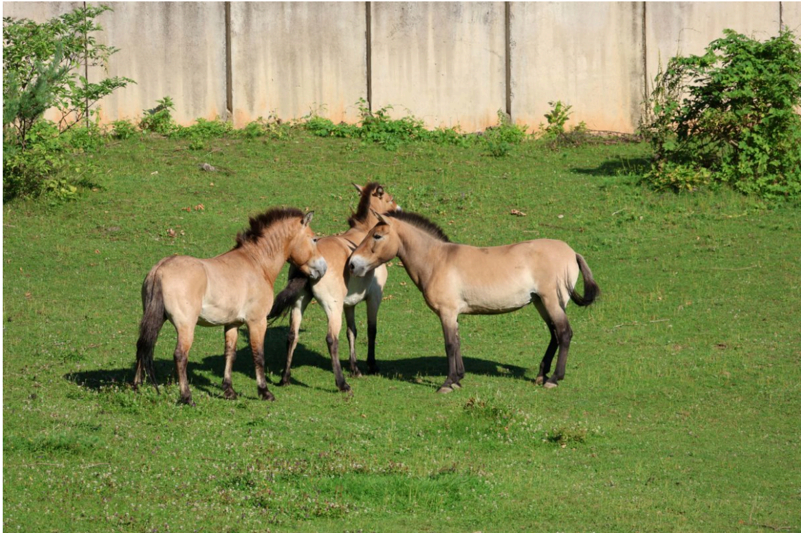
Przewalskipferd - Patrik Pastorek

Auch im Beweidungsprojekt der Königsbrunner Heide gab es Bestands-Veränderungen. Przewalski-Hengst Xarope wurde im Rahmen des Erhaltungszuchtprogrammes an den Zoo Kosice/Slowakei abgegeben und lebt dort nun mit zwei Stuten zusammen.