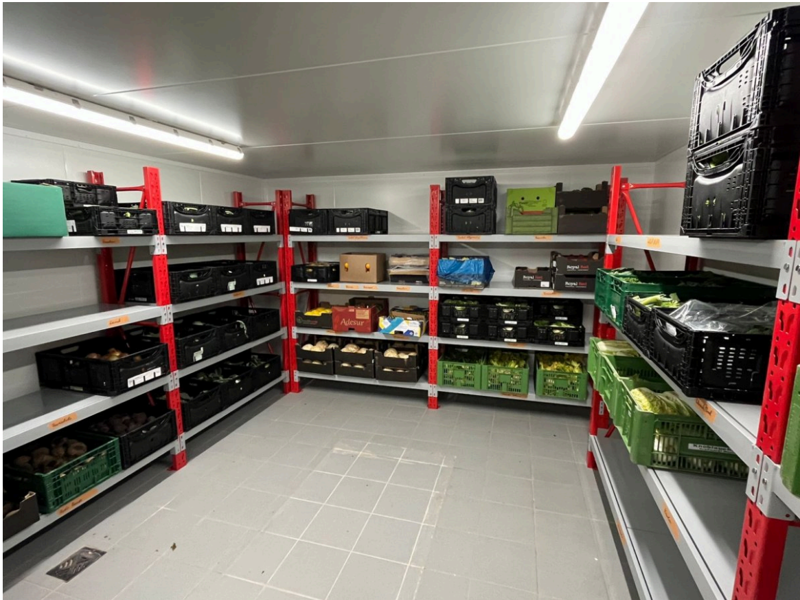
Kühlzelle - Danilo Rösch

werden nun sukzessive für andere Nutzungszwecke umfunktioniert. Als erste Neuerung wurde die ehemalige Männerumkleide zu einer Kühlzelle für Obst und Gemüse umgebaut.