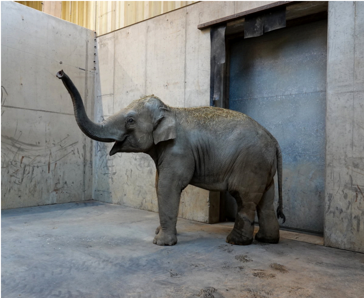
Elefant – Peter Bretschneider

Auch in unserer Grevyzebra-Herde gab es Zuwachs. Die Stute Petra aus dem Tierpark Berlin kam auf Empfehlung der EEP-Koordinatorin zu uns in die Fuggerstadt.