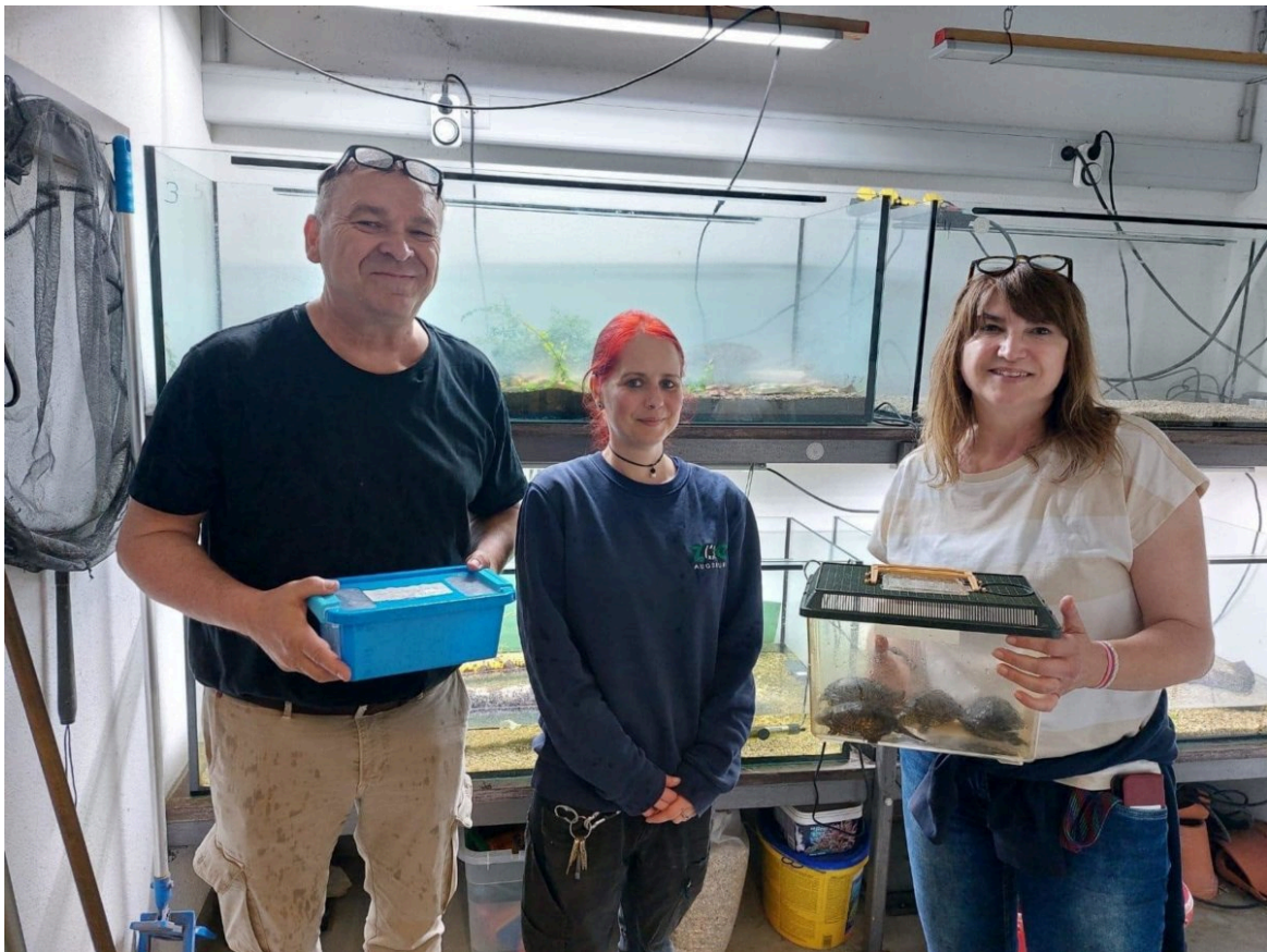
Sumpfschildkröte - Laura Japke

Vom Artenschutzprojekt Europäische Sumpfschildkröte in Hessen ( www.sumpfschildkröte.de http://www.sumpfschildkröte.de/ ) erhielten wir zum wiederholten Male Schlüpflinge. Diese stammen von Privatzüchtern und werden von unseren Pflegern hinter den Kulissen großgezogen, bis sie schwer genug für die Auswilderung sind.