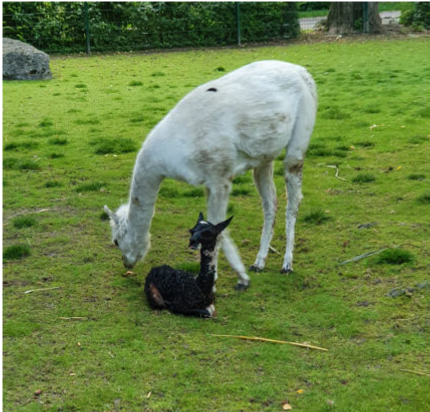
Alpaka, geboren 18.08.2019