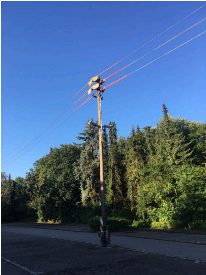
Umgebauter Strommasten

Ich wünsche Ihnen viel Spaß bei Ihrem nächsten Besuch, Ihr