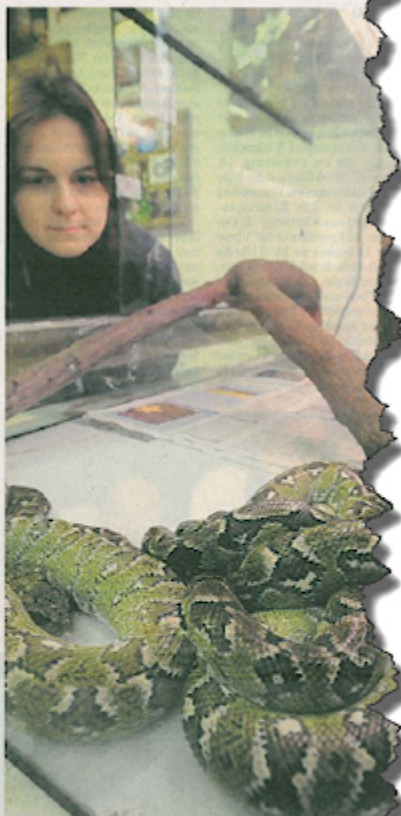
Die letzten Überlebenden: Diese jungen Hundköpfböas im Zoo sind nicht von der Krankheit IBD befallen, weil sie in einem separaten Bereich leben. Die Boa und andere Riesenschlangen mussten eingeschläfert werden.

Machtlos sind die Veterinärmediziner, wenn Tiere im Zoo allerschwach werden. Das war bei Amur-Leopard Mischa so. Er musste im Alter von 19 Jahren eingeschläfert werden, wie gestern ebenfalls bekannt gegeben wurde. Mischa sei immer gesund gewesen, vor einigen Tagen aber plötzlich matt geworden. Er wollte auch nicht mehr fressen. Ein Gesundheitscheck unter Narkose ergab schlechte Nierenwerte, aber sonst keine eindeutigen Krankheitsanzeichen. Die Tierärzte versuchten noch, mit Medikamenten zu helfen. Ohne Erfolg. Am Ende musste die Mischa eingeschläfert werden. (19)